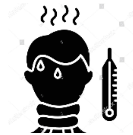
Temperaturmessung bei Eintritt in das Haus durch MA der Rezeption