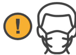
Tragepflicht einer FFP2 Maske im gesamten Haus; Stoffmasken, MNS Masken und Visiere sind nicht erlaubt;