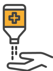
Händedesinfektion bei Eintritt in das Haus