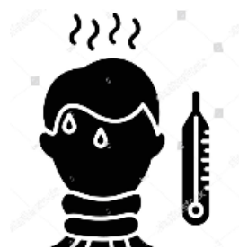
Temperaturmessung bei Eintritt in das Haus durch MA der Rezeption