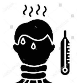
Temperaturmessung bei Eintritt in das Haus durch MA der Rezeption